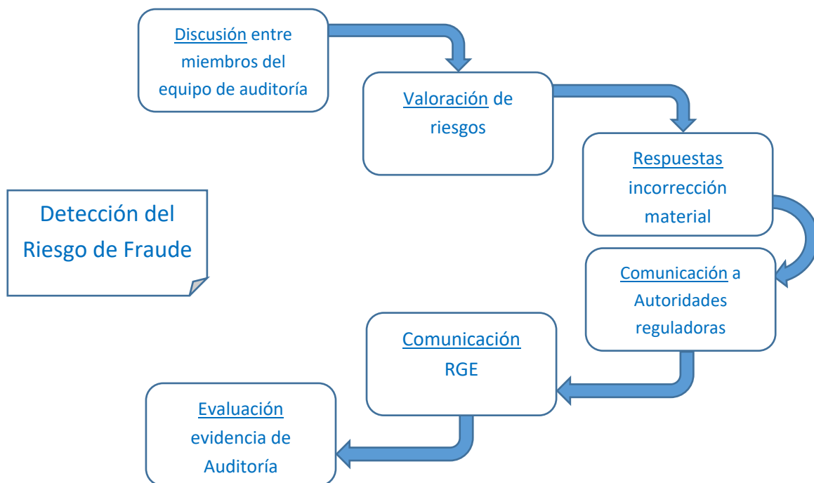
Figura 3. Etapas en el desarrollo del proceso de detección del riesgo de fraude en Auditoría.

En conclusión, atendiendo a la normativa vigente, los pasos a seguir por el auditor para la evaluación e identificación del fraude, podemos resumirlos en la siguiente línea del tiempo que nos va a indicar correlativamente la secuencia que nos indica la norma internacional de auditoría con adaptación al territorio nacional español en su número 240: