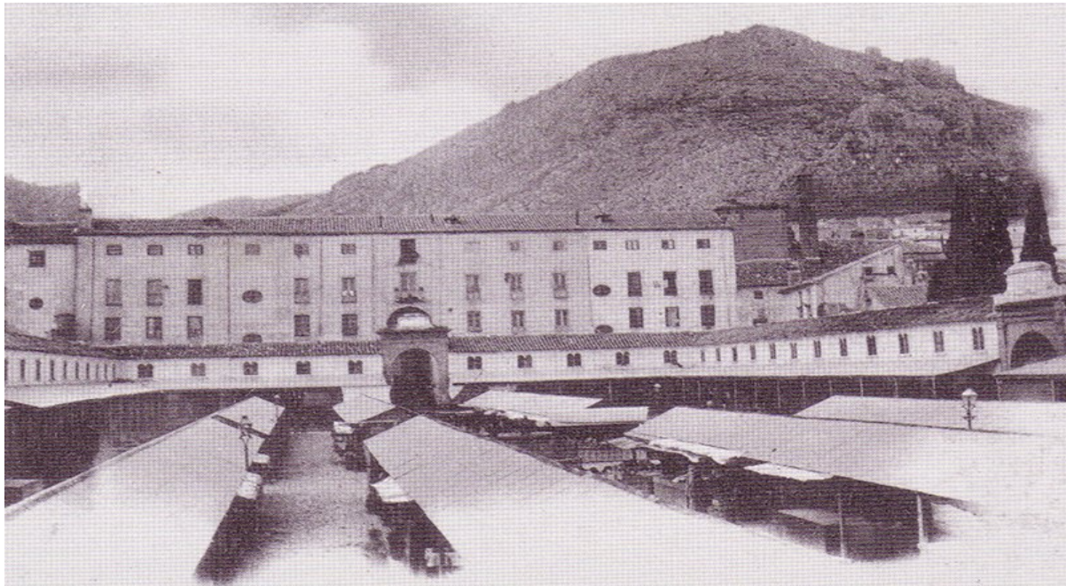
Figura 5. Mercado Municipal de San Francisco (Jaén) en 1904.