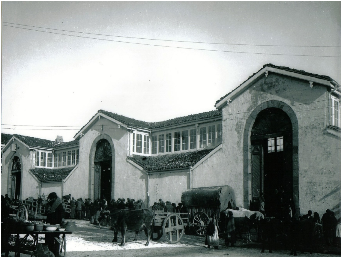
Figura 4. Mercado de Abastos de Reinosa en el siglo XIX.