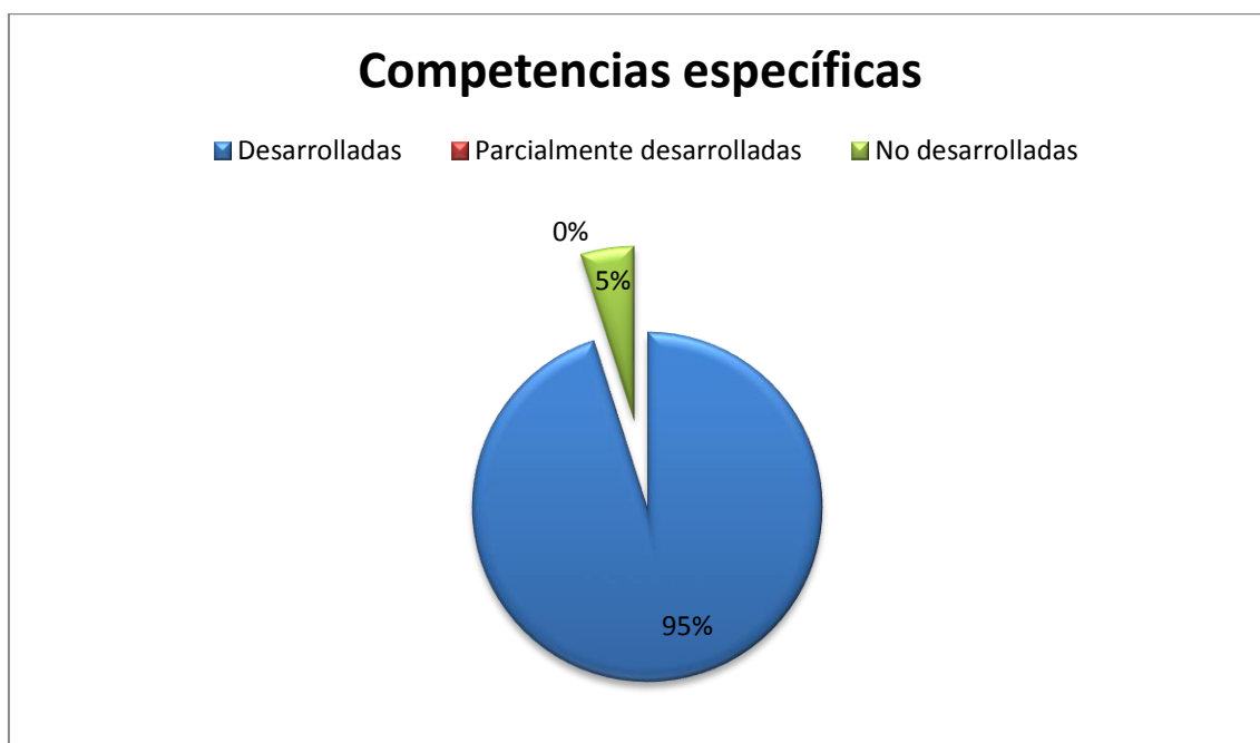
Gráfico circular 2. Grado de porcentaje de las competencias genéricas.