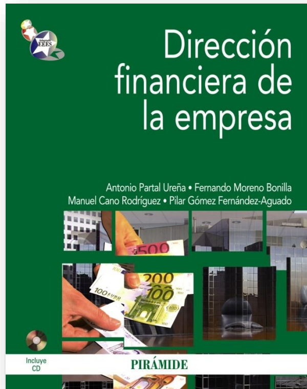
Figura 1: Evidencia de la utilización de libros de texto avanzados.