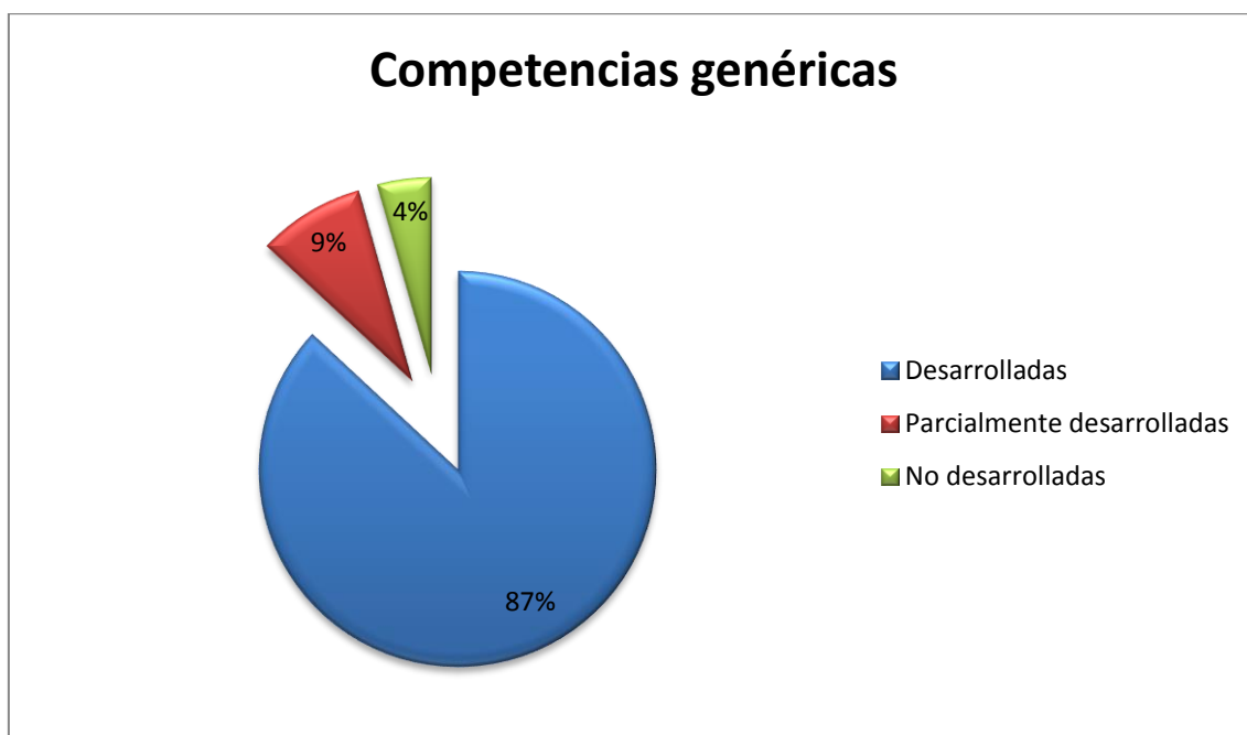
Gráfico circular 1. Grado de porcentaje de las competencias genéricas.