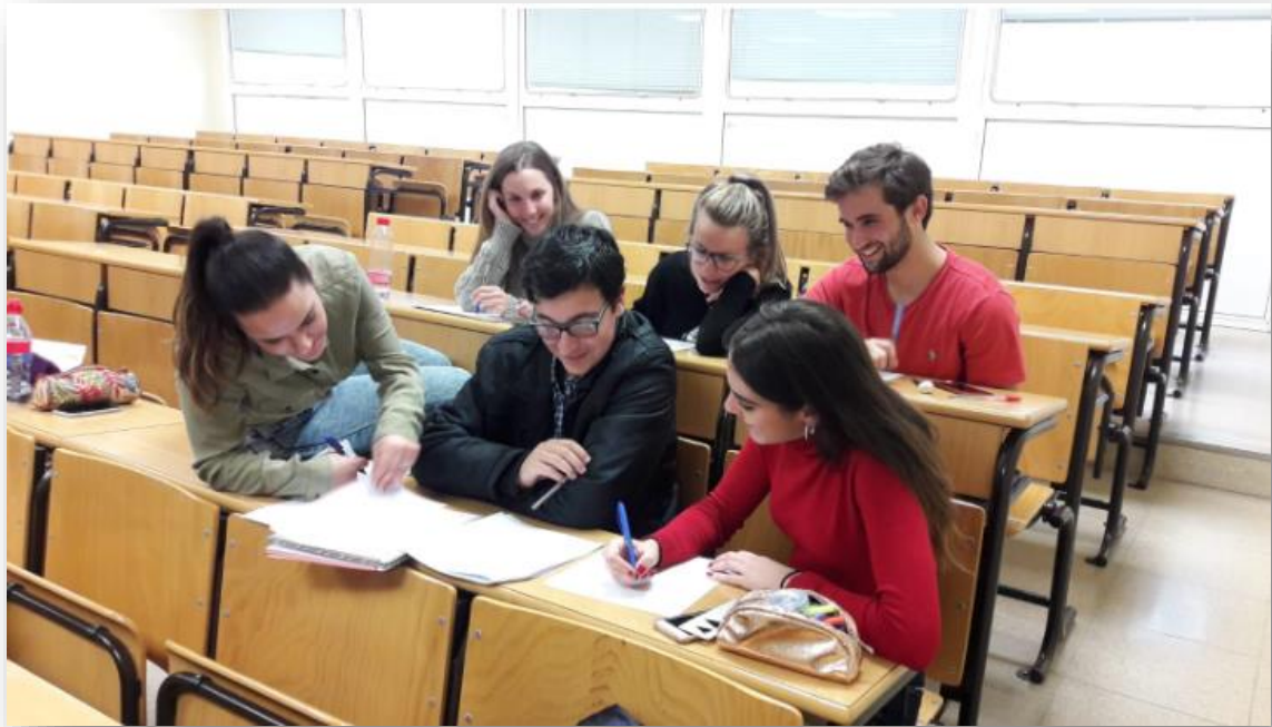
Figura 9: Evidencia complementaria de trabajo en equipo.