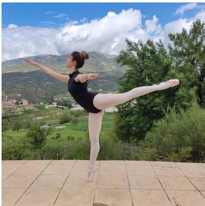
Figura 1. Arabesque en punta

Existen dos tipos de equilibrio, el equilibrio estático en el que se mantiene una postura con el mínimo movimiento y el equilibrio dinámico en el que el cuerpo es capaz de no perder ese equilibrio durante la ejecución de desplazamientos, cambios de posición o movimientos deseados(5). En ballet son fundamentales ambos ya que se necesita del equilibrio estático para realizar posiciones concretas siendo capaces de mantener la vertical con una base de apoyo muy reducida(13), como, por ejemplo, en la ejecución de un “arabesque en punta” y del equilibrio dinámico para realizar coreografías complejas, o en la ejecución de giros como por ejemplo los “fouettés”.