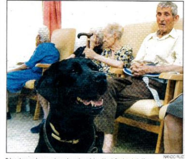
Palma, el perro-guía que convive con los ancianos de la residencia San Antonio de Albares. NAVICO FLEZ

Se llama Palma y con apenas seis años de edad, se ha prejubilado. Tras su trabajo en la Fundación ONCE, esta perra de raza labrador retriever, de color negro, algún achaque y corazón amable, ha cambiado su residencia canina en Boadilla del Monte (Madrid) por la residencia geriátrica San Antonio de Albares (Guadalajara). Hace una semana y media que llegó y ya disfruta de su nueva casa, del centenar de compañeros que allí viven y del entorno al que habrá de acostumbrarse, porque Palma no ha llegado de veraneo sino para quedarse. Tras el proceso de adaptación, esta perra voluntaria se convertirá en un auténtico motor en las terapias del centro, con enfermos. La residencia se convierte con este proyecto en la primera de la Región en el uso de perros-guía para terapias.