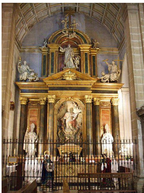
IMAGEN 8. Retablo de San Eufrasio en la catedral de Jaén. https://commons.wikimedia.org/wiki/File:Ja%C3%A9n_-_Catedral,_Capilla_de_San_Eufrasio_2.jpg (consultado por última vez el 28/06/2022)