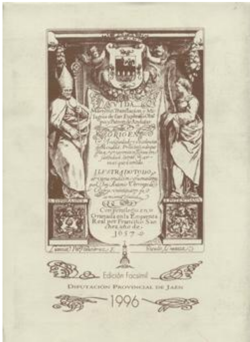
IMAGEN 7. Portada de Vida, Martyrio, Traslación Y Milagros De San Eufrasio, Obispo Y Patrón De Andújar https://www.elolivoeditorial.com/es/tienda/productos/historia-102/vida-martyrio-traslacion-y-milagros-de-san-eufrasio-obispo-y-patron-de-andujar-5801 (consultado por última vez el 28/06/2022)