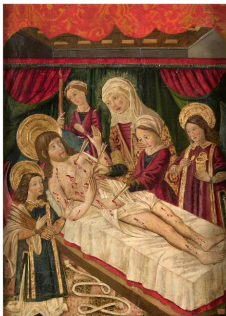
IMAGEN 23. Santa Irene arranca las flechas a San Sebastián . https://www.museodelprado.es/coleccion/obra-de-arte/santa-irene-arranca-las-flechas-a-san-sebastian/73bb6ba3-4fbc-4e77-b191-40ce8bd97cd1 (consultado por última vez el 28/06/2022)

IMAGEN 22. Santa Potenciana de Villanueva de la Reina . https://es.wikipedia.org/wiki/Potenciana_de_Villanueva (consultado por última vez el 28/06/2022)