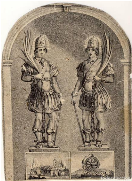
IMAGEN 4. Grabado de Bonoso y Maximiano atribuido a Carrafa y Altarriba

https://docs.google.com/document/d/1AIwXmB6b7gWV2CjTxxIoWp0c9HbhkqBKurdILPXsM/edit?hl=es (consultado por última vez el 28/06/2022)