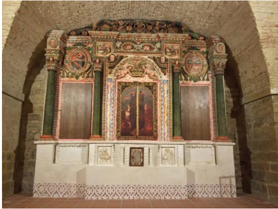
IMAGEN 5. Retablo de San Bonoso y San Maximiano.