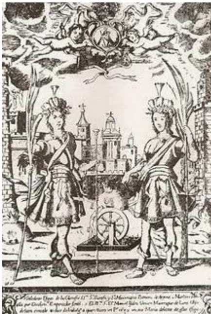
IMAGEN 2. Grabado del S.XVII de San Bonoso y San Maximiano. https://docs.google.com/document/d/1AIwXmB6b7gWVkv2CjTxxIoWp0c9HbhkqBKurdILPXsM/edit?hl=es (consultado por última vez el 28/06/2022)