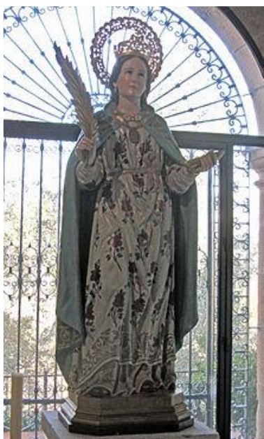
IMAGEN 22. Santa Potenciana de Villanueva de la Reina . https://es.wikipedia.org/wiki/Potenciana_de_Villanueva (consultado por última vez el 28/06/2022)

IMAGEN 21. San Pedro liberado por un ángel , de José de Ribera. https://www.museodelprado.es/coleccion/obra-de-arte/san-pedro-libertado-por-un-angel/4e59775d-75e6-425a-a6e8-9825b78acf6c