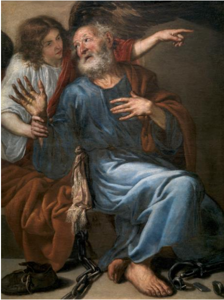
IMAGEN 19. San Pedro liberado por un ángel , de Antonio de Pereda y Salgado. https://www.museodelprado.es/coleccion/obra-de-arte/san-pedro-liberado-por-un-angel/b55236c9-4e94-4df6-8092-75799c06c251 (consultado por última vez el 28/06/2022)