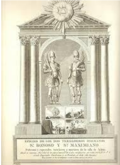
IMAGEN 3. Grabado de Bonoso y Maximiano de 1732.

https://docs.google.com/document/d/1AIwXmB6b7gWV2CjTxxIoWp0c9HbhkqBKurdILPXsM/edit?hl=es (consultado por última vez el 28/06/2022)