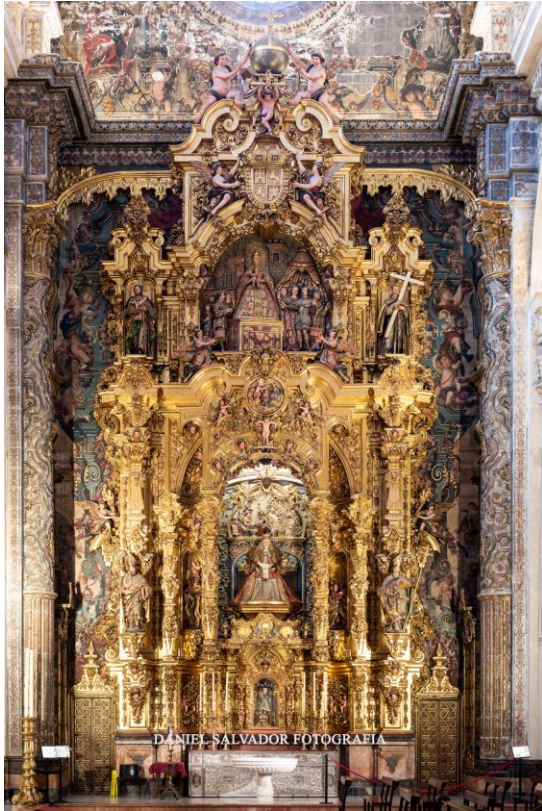
IMAGEN 26. Retablo de la virgen de las aguas de la iglesia colegial del Divino Salvador.