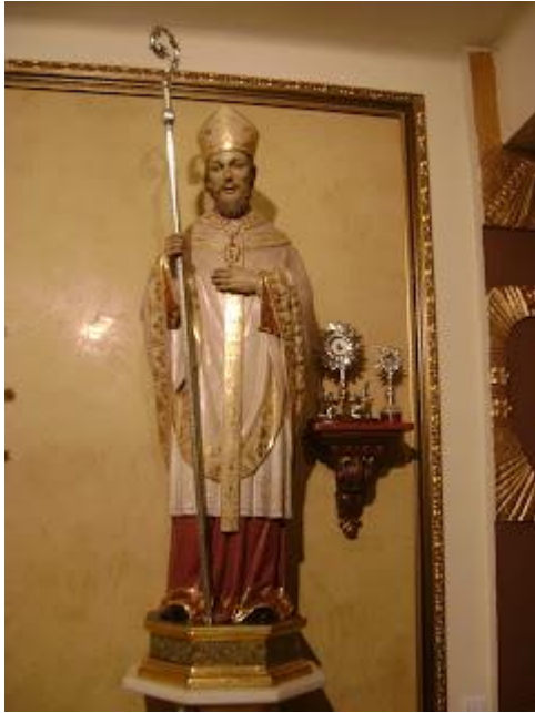
IMAGEN 11. Talla de San Eufrasio en Andújar. http://deescuadrasatramos.blogspot.com/2015/12/una-cofradia-de-ser-caudal-que-alimente.html