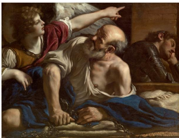
IMAGEN 18. San Pedro liberado por un ángel , de Guercino. https://www.museodelprado.es/coleccion/obra-de-arte/san-pedro-liberado-por-un-angel/cf7ada47-9749-4989-9d50-8a46ee1c4192 (consultado por última vez el 28/06/2022)