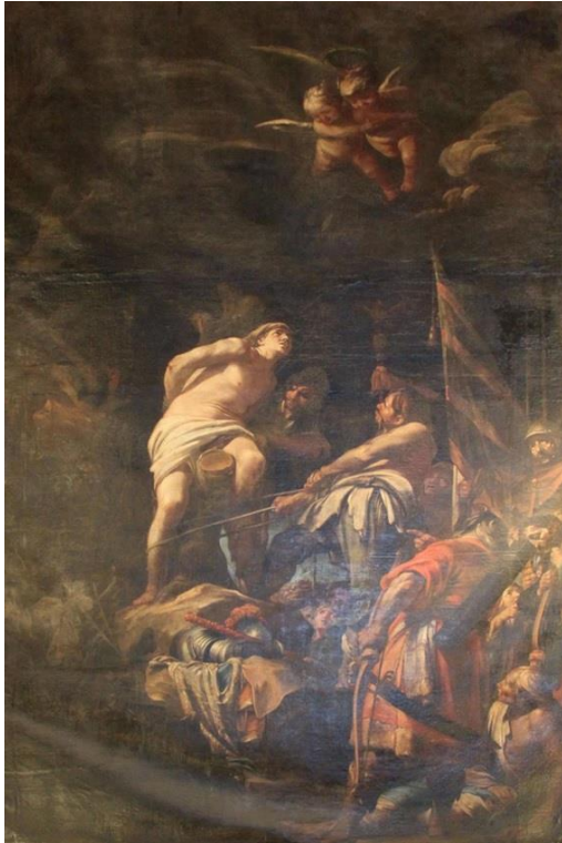
IMAGEN 24. San Sebastián, de la catedral de Jaén. http://www2.ual.es/ideimand/portfolio-items/sebastian-martinez-domedel-martirio-de-san-sebastian-1663-catedral-de-jaen-capilla-de-san-juan-nepomuceno-y-san-sebastian/ (consultado por última vez el 28/06/2022)