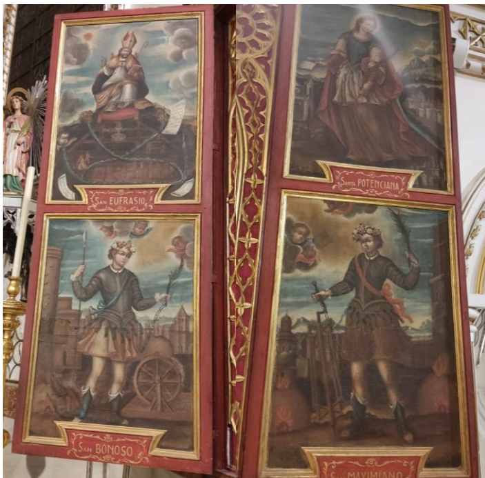
IMÁGENES 12 Y 13. Fotografías del relicario de la capilla del Cristo de la Agonía de Santa María la Mayor Andújar, echas por mí misma.