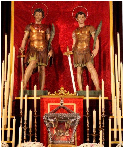
IMAGEN 6. Tallas de Bonoso y Maximiano.