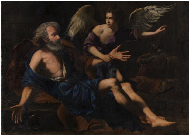
IMAGEN 20. San Pedro liberado por un ángel , de Tommaso Salini. https://www.museodelprado.es/coleccion/obra-de-arte/san-pedro-liberado-por-un-angel/65ca7348-d005-4f9a-b046-4d32a2654a9d (consultado por última vez el 28/06/2022)