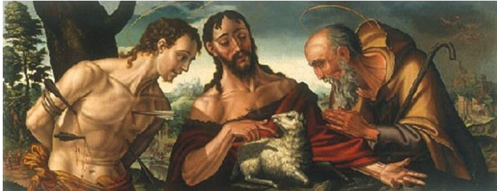
IMAGEN 25. San Sebastián, San Juan Bautista y San Antón, de la catedral de Sevilla. https://commons.wikimedia.org/wiki/File:San_Sebasti%C3%A1n,_San_Juan_Bautista_y_San_Ant%C3%B3n_%28Retablo_de_la_capilla_de_los_Evangelistas_de_la_catedral_de_Sevilla%29.jpg (consultado por última vez el 28/06/2022)