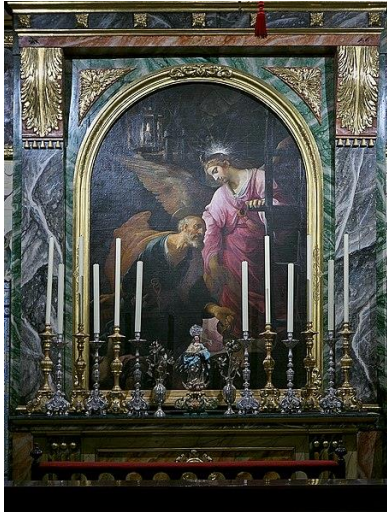
IMAGEN 16. Liberación de San Pedro por un ángel , en la catedral de Baeza. https://commons.wikimedia.org/wiki/File:La_liberaci%C3%B3n_de_San_Pedro_por_el_%C3%A1ngel,_Juan_de_Roelas.jpg (consultado por última vez el 28/06/2022)