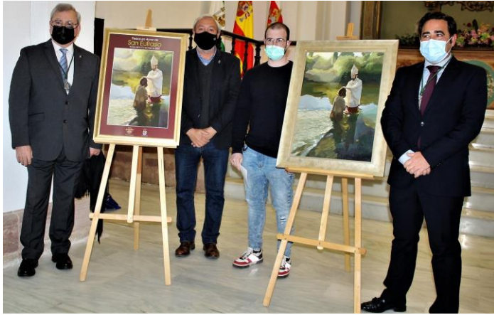
IMAGEN 14. Fotografía donde podemos ver el cartel de las fiestas en honor a San Eufrasio de 2022 y el cuadro original. https://andujar.ideal.es/andujar/devocion-eufrasio-vuelve-20220326185325-nt.html (consultado por última vez el 28/06/2022)