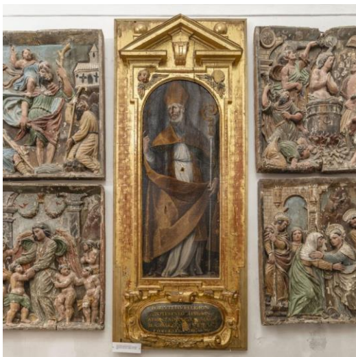
IMAGEN 10. Imagen de San Eufrasio de la catedral de Baeza. https://catedraldebaeza.es/museo-catedralicio/ (consultado por última vez el 28/04/2022)