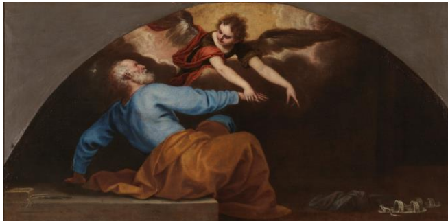
IMAGEN 17. Liberación de San Pedro por un ángel , de Alonso Cano. https://www.museodelprado.es/coleccion/obra-de-arte/san-pedro-liberado-por-un-angel/289437e4-d432-43ee-828b-e43680f732aa (consultado por última vez el 28/06/2022)