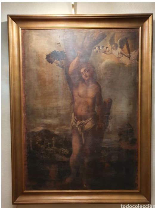
IMAGEN 27. Imagen de San Sebastián en la catedral de Baeza. https://www.todocoleccion.net/arte-pintura-oleo/san-sebastian-oleo-sobre-lienzo-siglo-xvii-gran-formato-imponente~x229536265 (consultado por última vez el 28/06/2022)