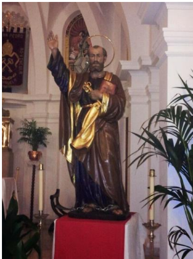
IMAGEN 15. Talla de San Pedro ad Vincula en Escañuela. http://mjquesta.blogspot.com/2014/07/la-imagen-de-san-pedro-advincula-de.html (consultado por última vez el 28/06/2022)