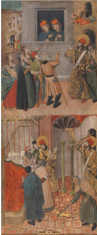
IMAGEN 28. San Sebastián habla a Marcos y a Marceliano y san Sebastián y san Policarpo destruyendo los ídolos https://www.museodelprado.es/coleccion/obra-de-arte/san-sebastian-habla-a-marcos-y-a-marceliano-y-san/0719d982-abfe-40eb-836c-4285f218bd31 (consultado por última vez el 28/06/2022)