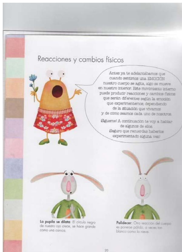
Figura 3. Ejemplo de reacciones fisiológicas que se experimentan con las emociones.