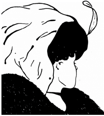
Figura 1 (Foley, 1996, pág. 163).

Esta imagen conocida como mi suegra o mi esposa, nos muestra la relación de figura-fondo. Esta imagen representa la explicación de actividad perceptual que aborda la Gestalt.