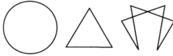
Figura 2. Las 3 partes del símbolo Eneagrama (Riso, 2011, pág. 19)

Al producir la unión de estos elementos: círculo, triángulo y hexada se conforma el Eneagrama. Se integra la unidad en su totalidad (círculo), se genera una identidad tras la combinación de las 3 fuerzas (triángulo), la cual invita a una evolución y transformación que se genera en el tiempo debido al movimiento y constante cambio (hexada). (Santilli, 2020)