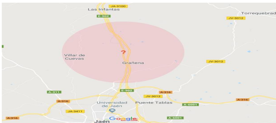
Imagen 1: mapa del centro penitenciario Jaén 1.

Y en cuanto a la cobertura espacial, la intervención tiene un alcance a nivel provincial porque afecta a toda la provincia pero se puede realizar en otros centros penitenciarios.