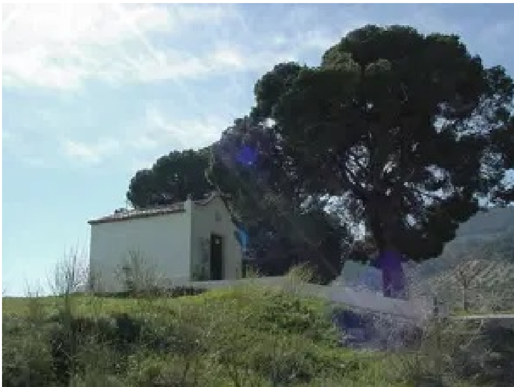
Anexo 2. Nicho de la Legua actual.