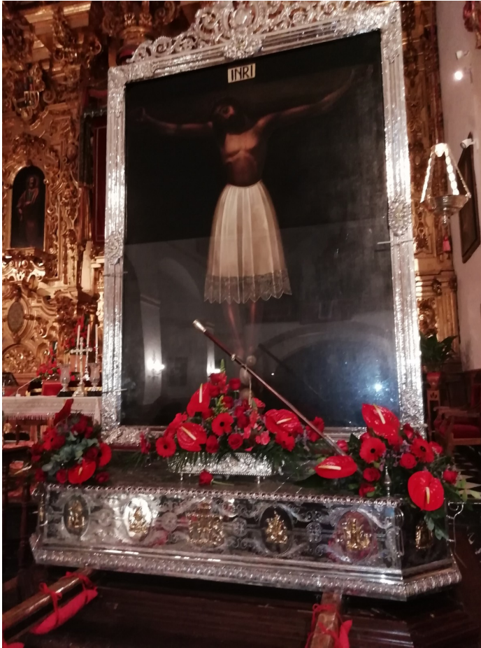
Anexo 3 Santo Cristo de Burgos. Cabra del Santo Cristo.