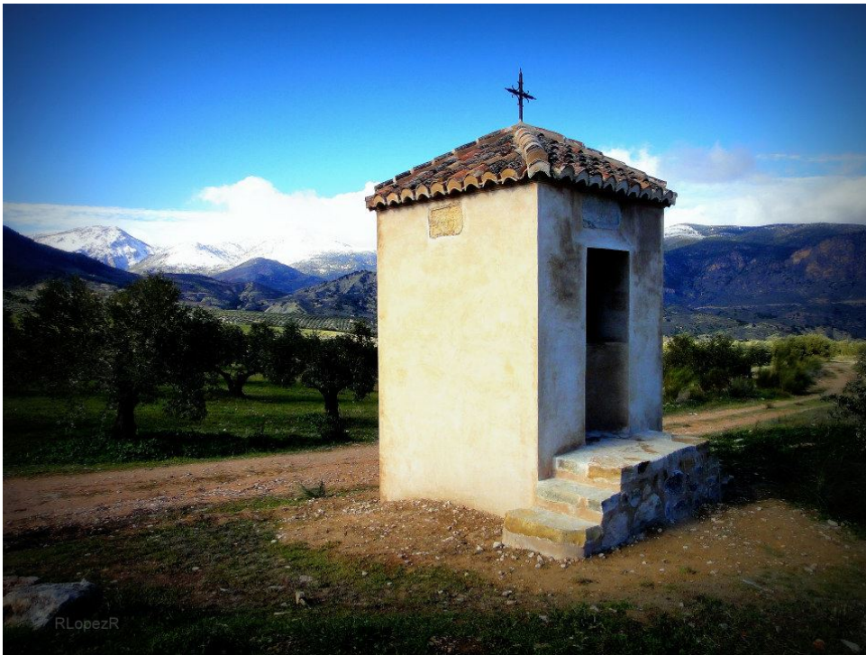
Anexo 1, Imagen del Nicho de la Legua Antiguo.