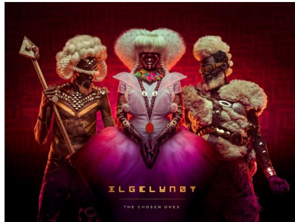
Figura IX. Osborne Macharia

El fotógrafo Osborne Macharia es el referente afrofuturista más conocido, cuyas campañas sobre minorías y cultura pop son fácilmente identificables por su cuidada puesta en escena.