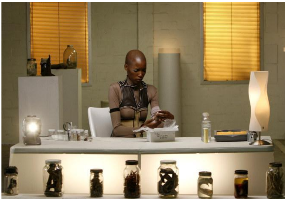
Figura IV. Pumzi.

Pumzi (2009), de la keniana Wanuri Kahiu inauguró el catálogo cinematográfico de ciencia ficción africana de las últimas décadas. Se trata de un cortometraje postapocalíptico en el que la naturaleza se ha extinguido y la población sobrevive en comunidades del interior de la tierra.