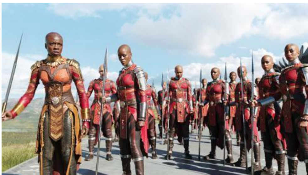
Figura V. El ejército de las Dora Milaje (Black Panther, 2018).

Disney está preparando asimismo Kizazi Moto: Generation Fire , una antología de diez películas de animación afrofuturista creadas por autores africanos, a la vez que se ha aliado con la compañía panafricana Kugali para producir Iwájú , una serie de animación situada en un Lagos (Nigeria) futurístico.