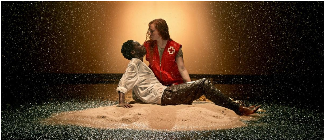
Campaña Me quedo contigo, de Cruz Roja (2019)

Cabe destacar que el código de conducta en imágenes y mensajes desarrollado por CONCORD (Confederación europea de ONG para el desarrollo y la ayuda humanitaria) establece en su código de conducta la conveniencia de “representar honradamente cualquier imagen o situación, ambas en su entorno más próximo y en su contexto más amplio en tanto que mejorar el conocimiento del público sobre la realidad y las complejidad del desarrollo”, así como “evitar imágenes o mensajes potencialmente estereotipadas, sensacionalistas o que discriminen a las personas, situaciones o lugares”.