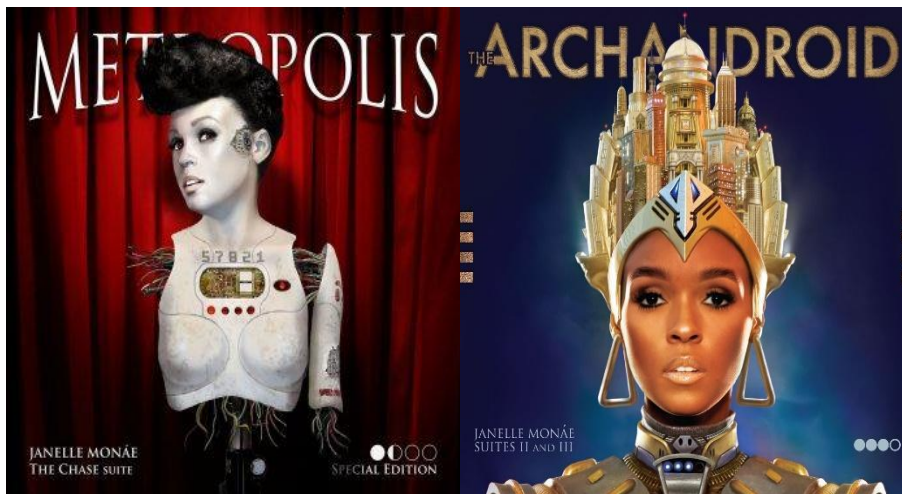
Figuras VI y VII. Portadas de los álbumes Metropolis (2007) y ArchAndroid (2010) de Janelle Monáe.

La artista más representativa es Janelle Monáe. Junto con su alter ego androide Cindy Mayweather , inspirado parcialmente en la película Metropolis (1927) de Fritz Lang, es uno de los referentes contemporáneos del Afrofuturismo. En sus álbumes Dirty Computer , Metropolis y ArchAndroid recoge multitud de referencias a míticas obras de ciencia ficción del siglo XX. Los androides son los protagonistas a través de los cuales refleja temáticas sobre identidad, activismo, resistencia, feminismos mundos o disidencia sexual.