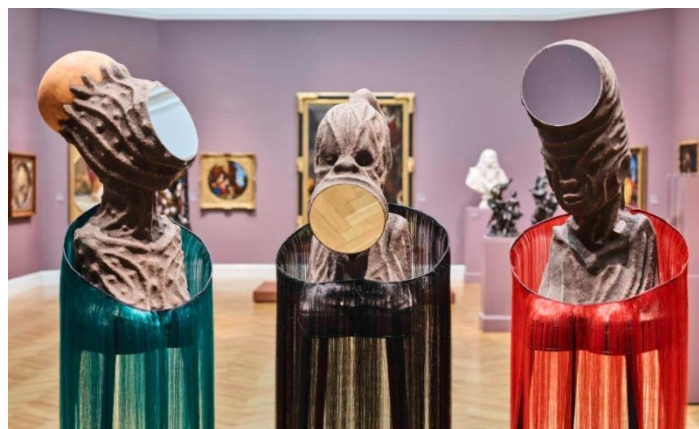
Figura IX. Estoy hablando, ¿estás escuchando?, de Wangechi Mutu

En escultura Ekow Nimako se sirve únicamente de piezas negras de Legos para realizar versiones de las máscaras tradicionales, esculturas figurativas o maquetas de antiguas ciudades africanas y Wangechi Mutu realiza grandes esculturas en bronce de mujeres y criaturas híbridas, relacionando ecología, feminismo y vidas y seres mitológicos.