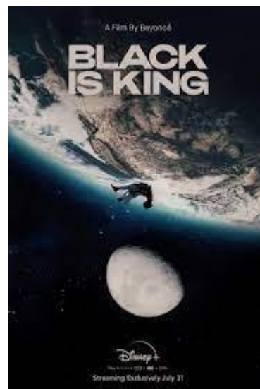
Figura VIII. Black is King (2020) de Beyonce

Beyoncé, con su álbum visual Black is King (basado en la historia del Rey León) también se sumerge en la representación afrofuturista, mostrando aspectos como el orgullo identitario, la ascendencia, la cosmogonía o referencias a pueblos de África. Anteriores trabajos de la artista, como Lemonade o Sweet Dreams ya exploraban esta vertiente, especialmente en las partes visual y estilística.