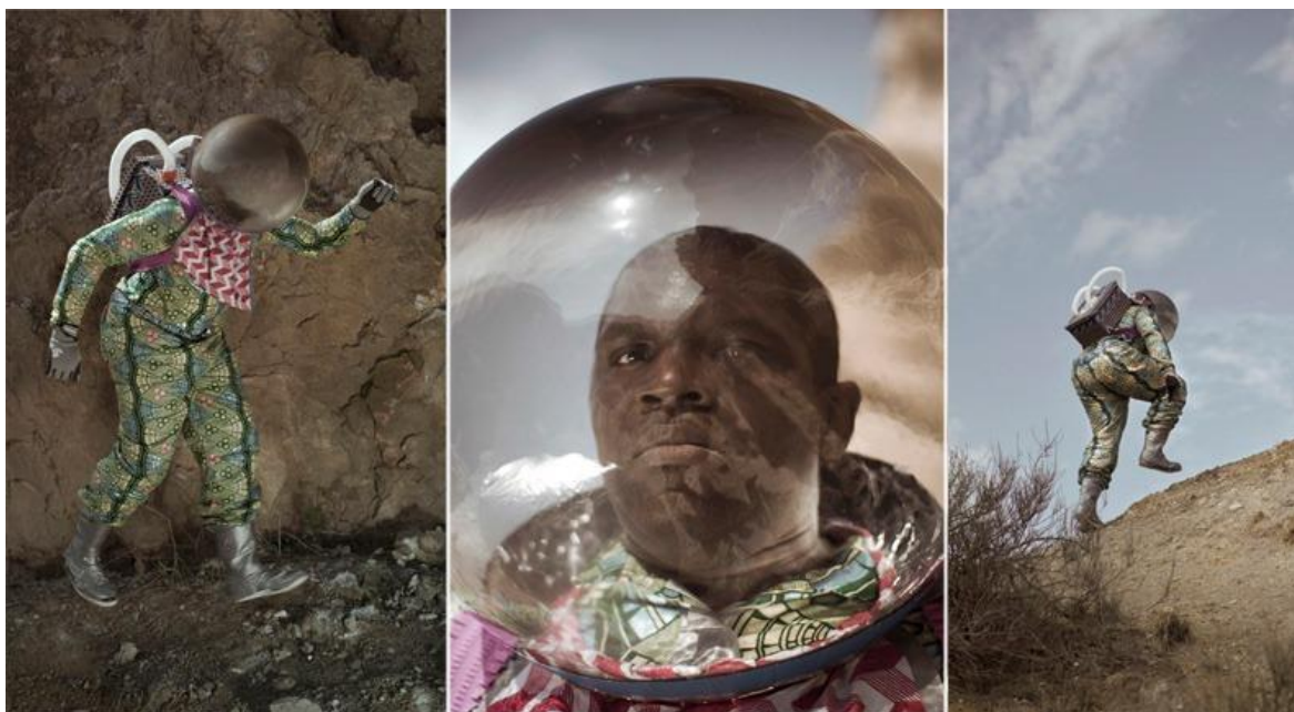
Figura III. Serie Afronauts , de Cristina de Middel.

A título individual, la fotógrafa Cristina de Middel realizó la serie Afronauts (2014), sobre un proyecto del gobierno de Zambia en plena Guerra Fría para enviar al primer ser humano a la luna. También Miguel Llansó grabó en 2015 Crumbs , la primera película etíope de ciencia ficción post-apocalíptica.