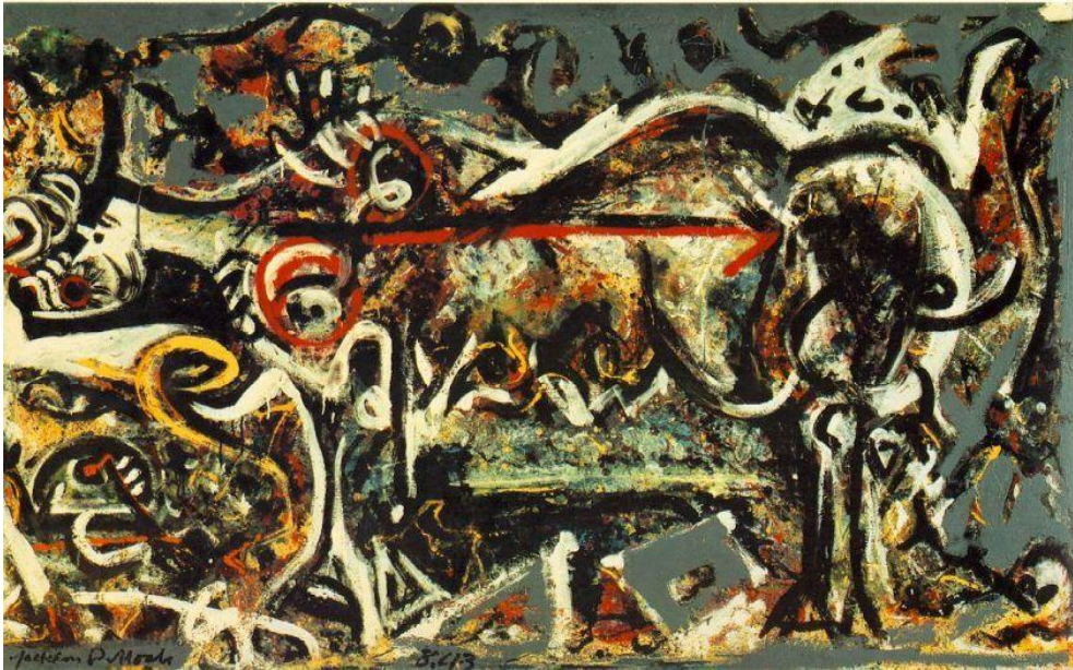
Pollock, J. (1943). The- she Wolf [Expresionismo abstracto]. Recuperado de http://arteac.es/jackson-pollock-expresionismo-abstracto/