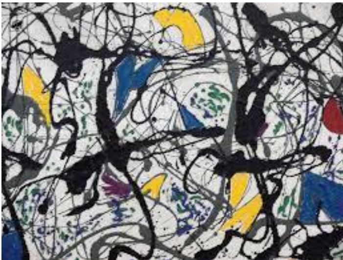
Pollock, J. (1948). Summertime Number 9A [Expresionismo abstracto]