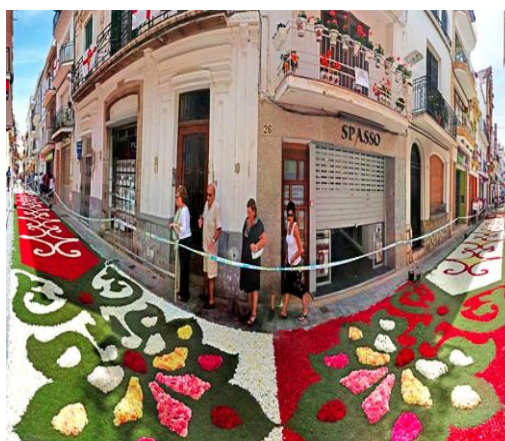
Calle decorada para el Corpus: