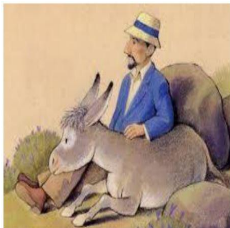
Ilustración de Platero y yo : https://www.navarraconfidencial.com/blog/platero-y-yo/

Va a tu alma, que ya paze en el Paraíso, por el alma de aquellos paisajes moguerenos 3 , qué también habrá subido al cielo con la tuya; lleva montada en su lomo de papel a la mía, que, caminando entre zarzas en flor a su ascensión, se hace más buena, más pacífica, más pura cada día.