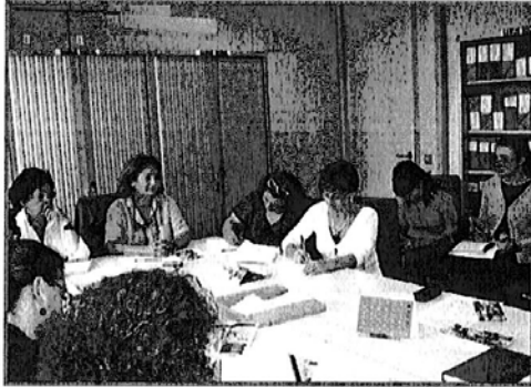
Reunión de la Mesa por la Igualdad

– Para alcanzar la meta de la igualdad, es necesario dar respuesta a las necesidades más específicas de la mujer gitana en todos los ámbitos de participación, especialmente el empleo y la formación, desde una perspectiva cultural y de género que las sitúe en igualdad de oportunidades respecto a los hombres de su comunidad y las mujeres de la sociedad mayoritaria