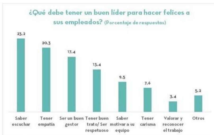
Figura 3. Características de un líder para hacer felices a los trabajadores