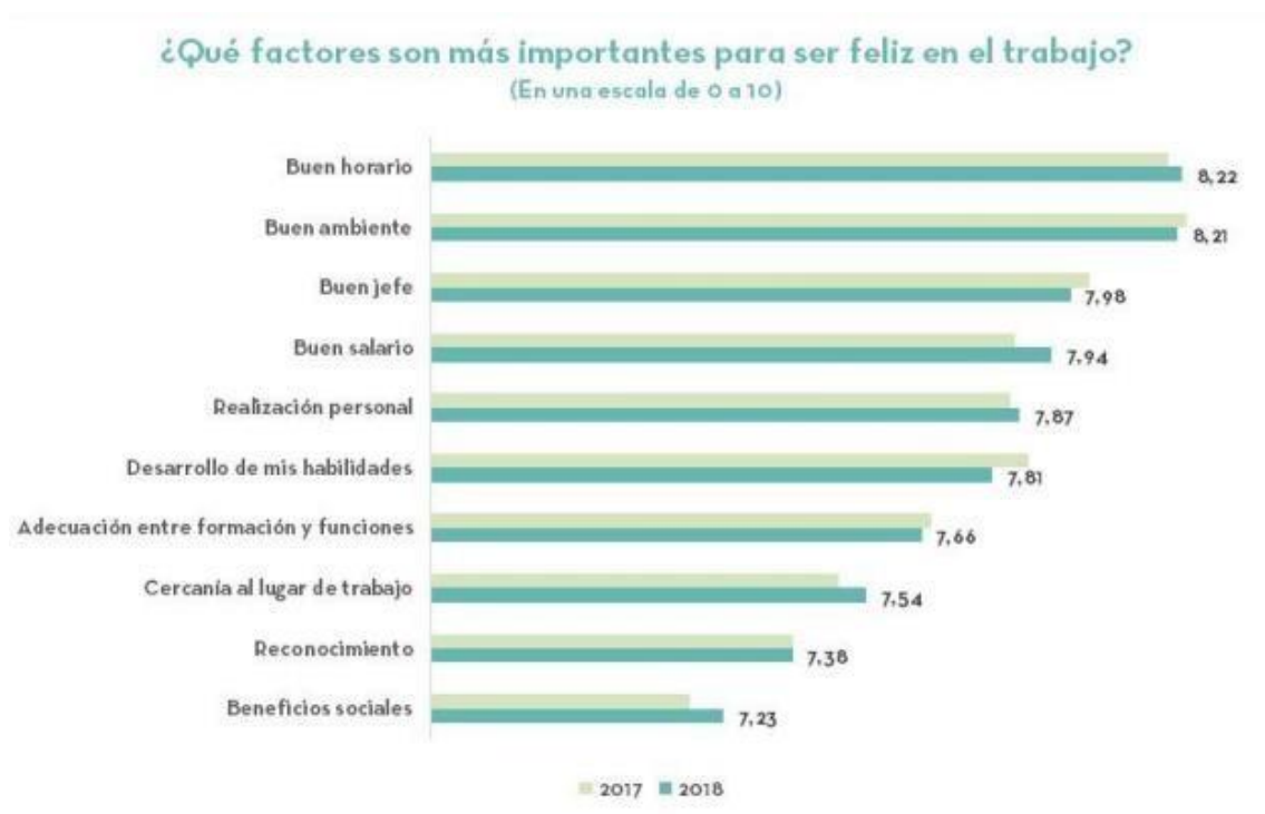
Figura 2. Factores de felicidad en el trabajo

Fuente: VIII Encuesta Adecco “La felicidad en el trabajo” (2018)