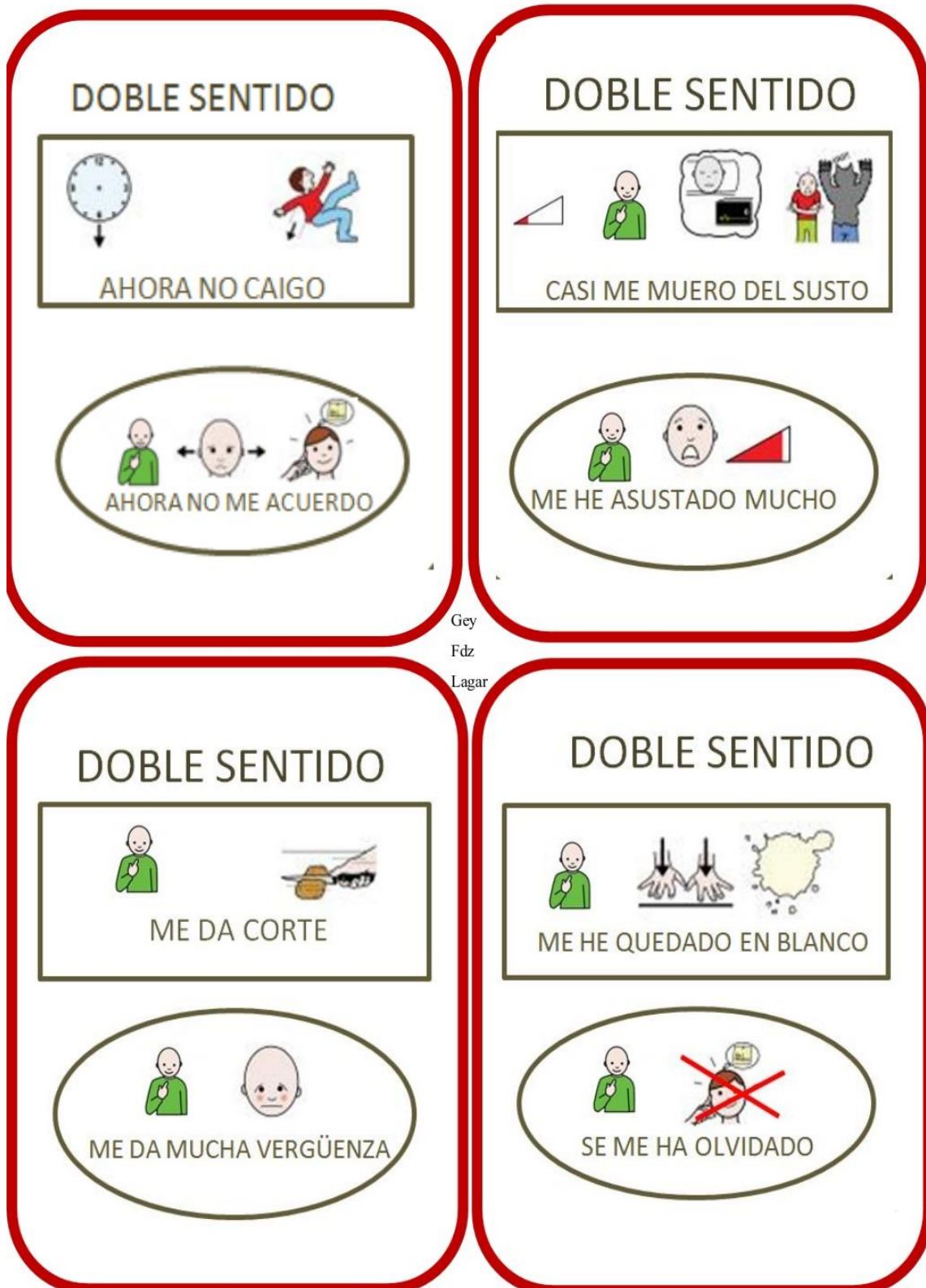
Imagen 7: pictograma mostrado al alumno.

En la segunda actividad, con el uso de los siguientes pictogramas, se explicarán al alumno los dobles sentidos.