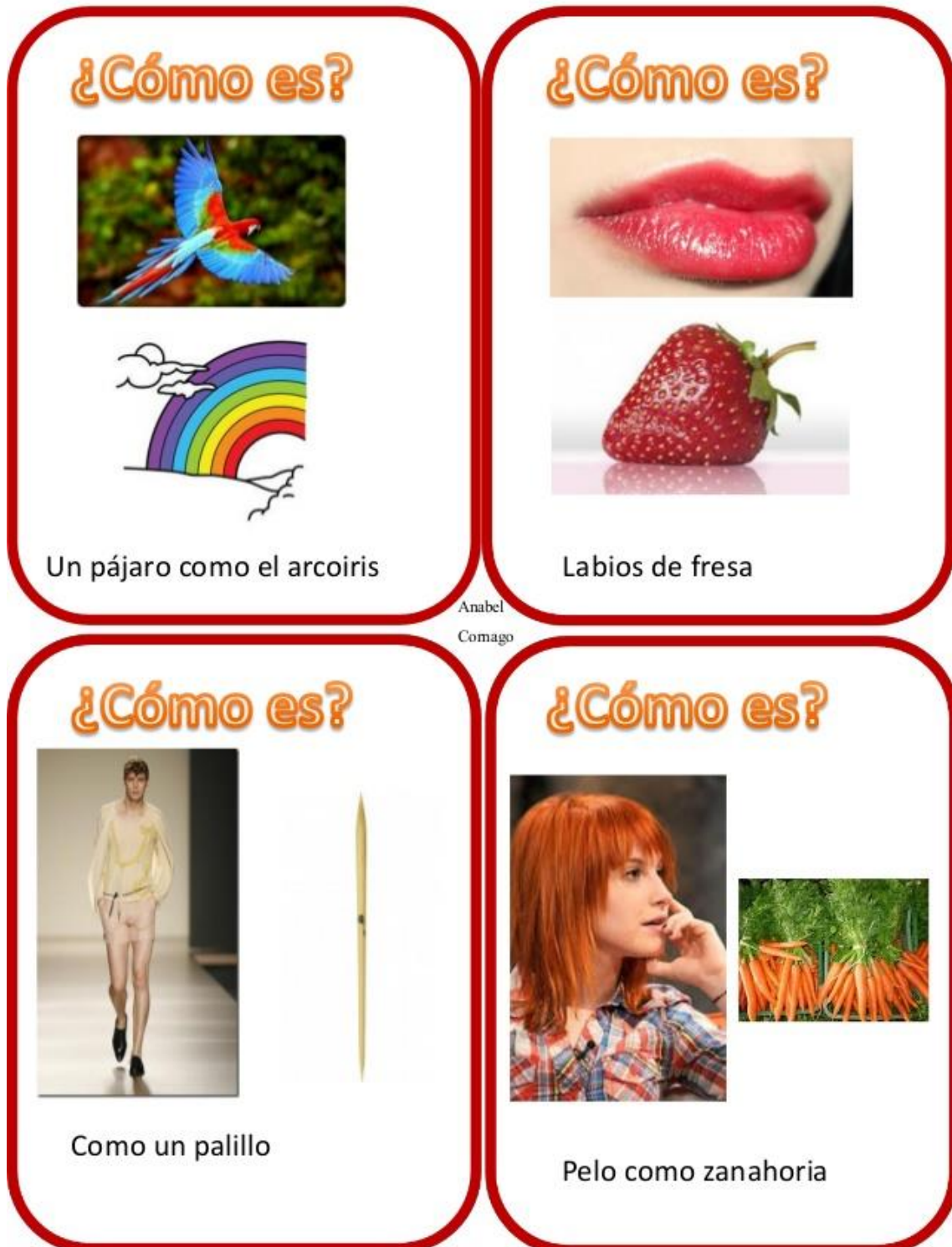
Imagen 9: ficha presentada al alumno.

Por último, para la actividad tres se mostrarán fichas con múltiples metáforas, donde el alumno podrá comprender el significado de muchas comparaciones utilizadas en las conversaciones de la vida diaria.