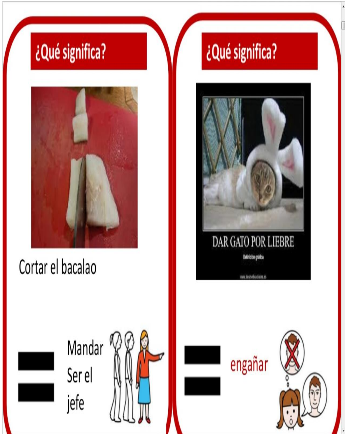
Imagen 6: ficha para el alumno.