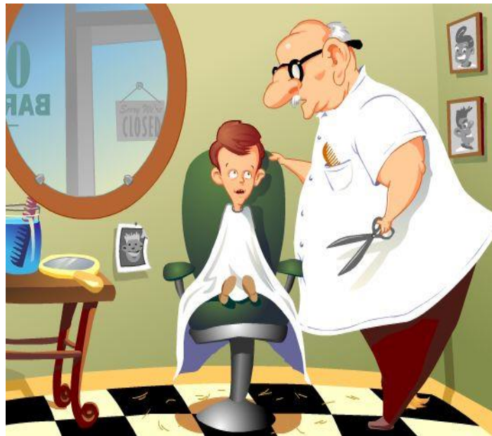
Imagen 2: ficha para el alumnado.