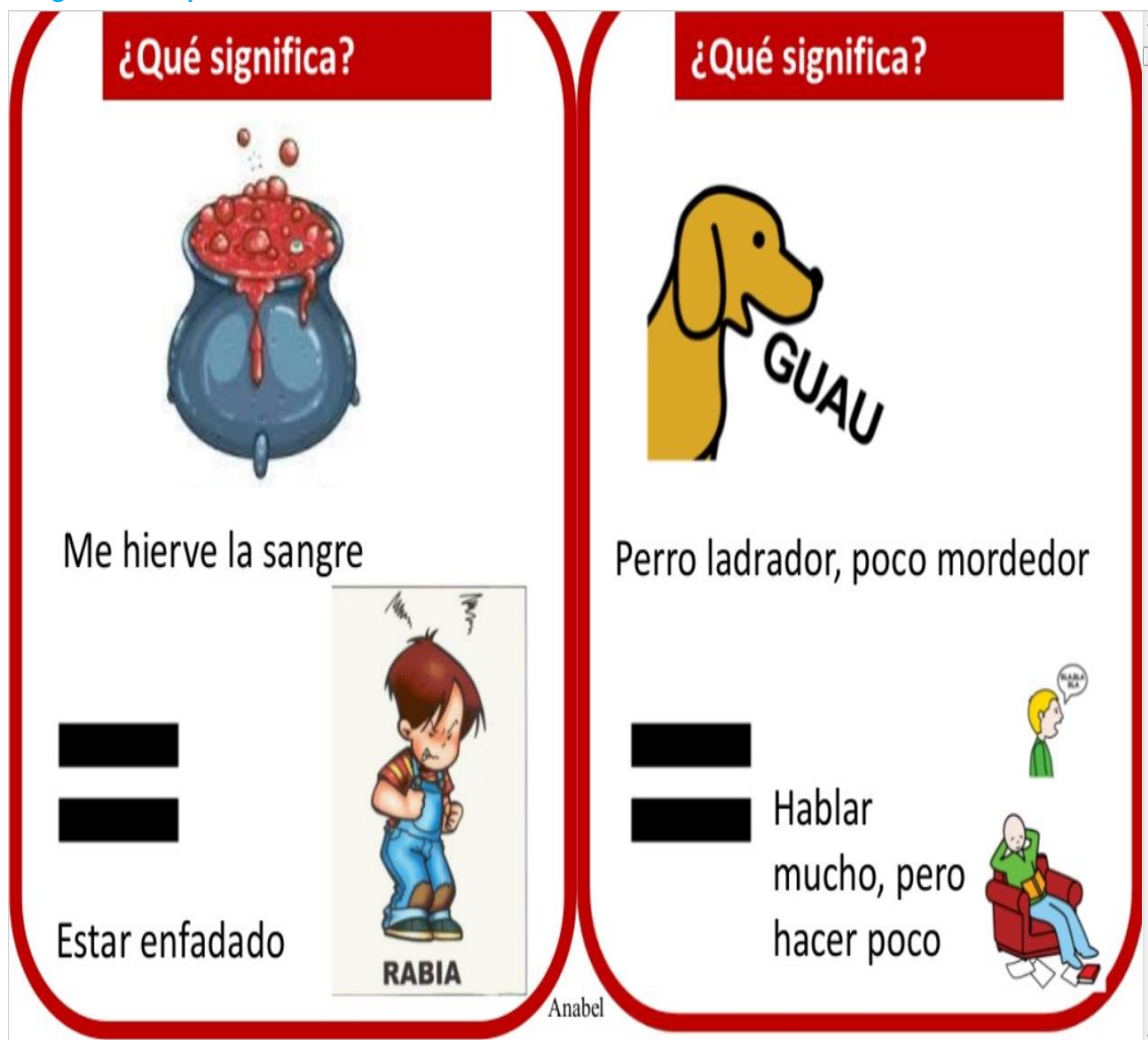
Imagen 5: ficha para el alumno.