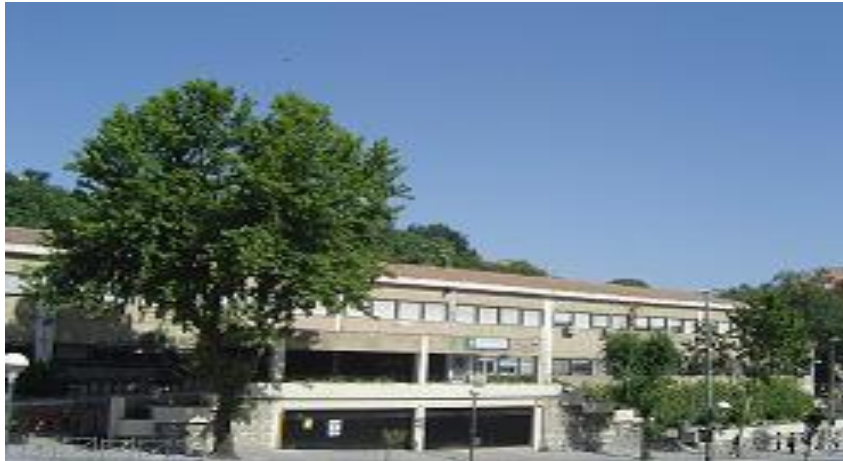
Imagen 1. I.E.S. "Jabalruz" (Jaén)