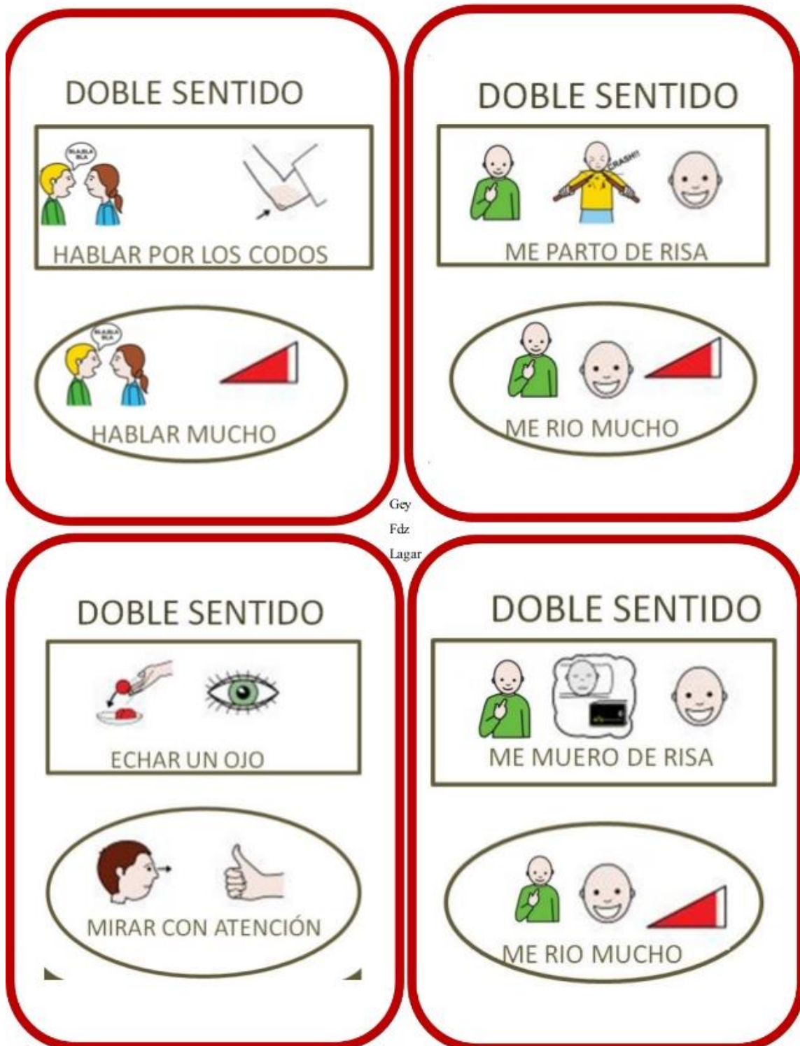
Imagen 8: pictograma mostrado al alumno.