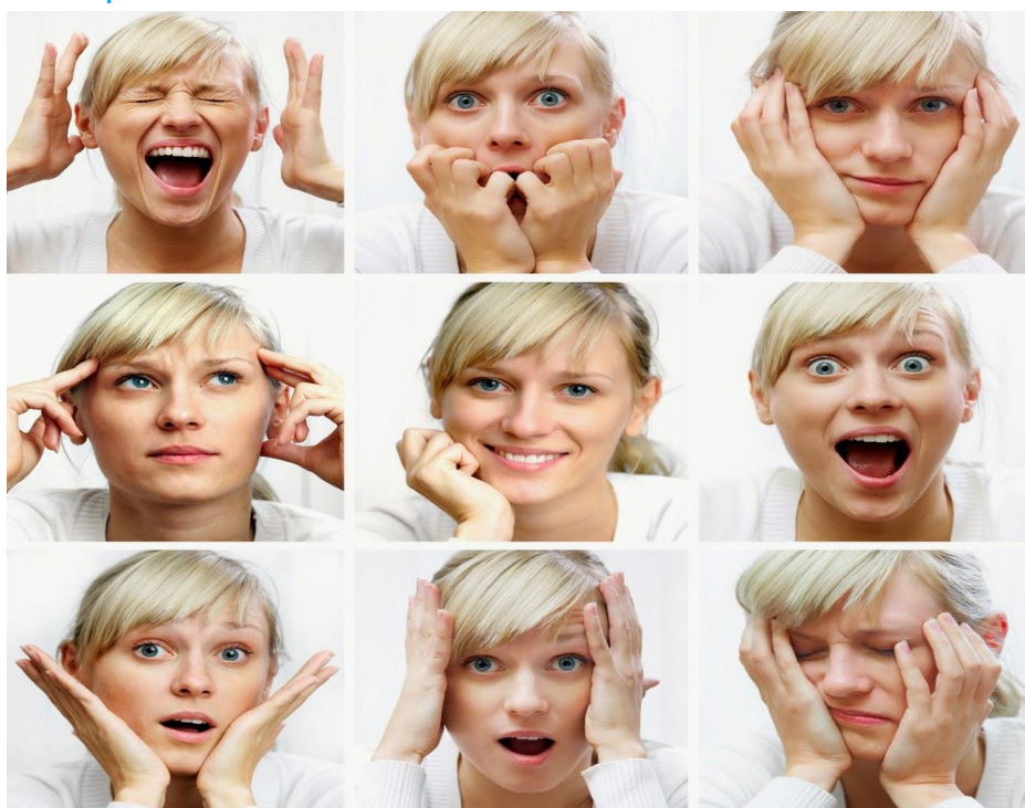
Imagen 4: ficha para el alumno.