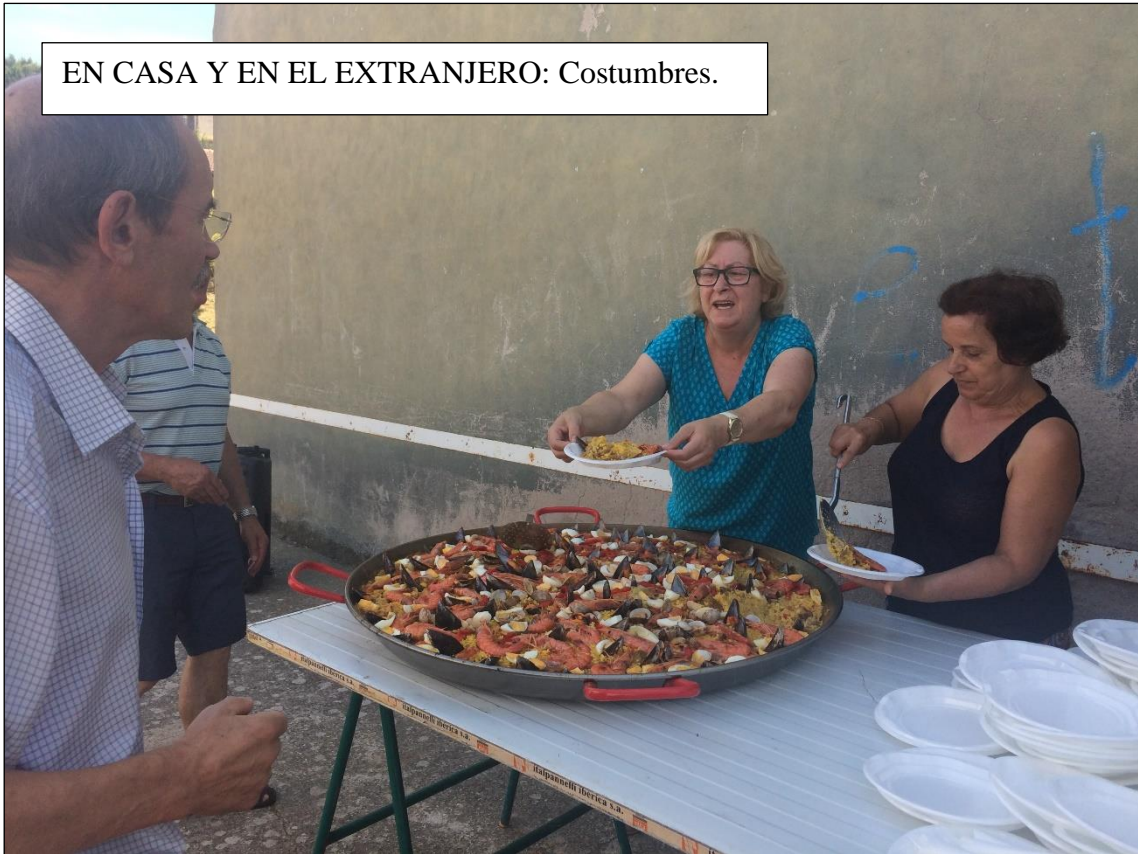
EN CASA Y EN EL EXTRANJERO: Costumbres.