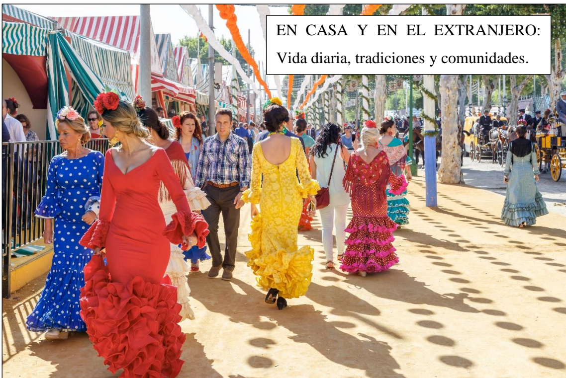
EN CASA Y EN EL EXTRANJERO: Vida diaria, tradiciones y comunidades.