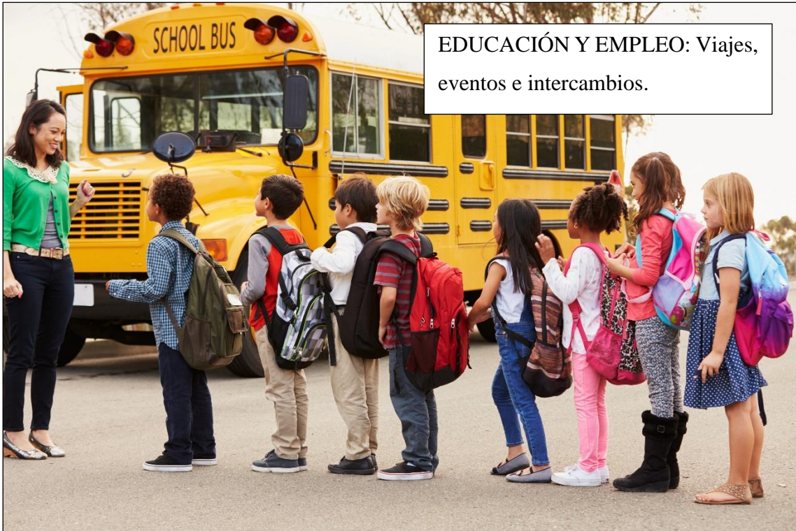
EDUCACIÓN Y EMPLEO: Viajes, eventos e intercambios.