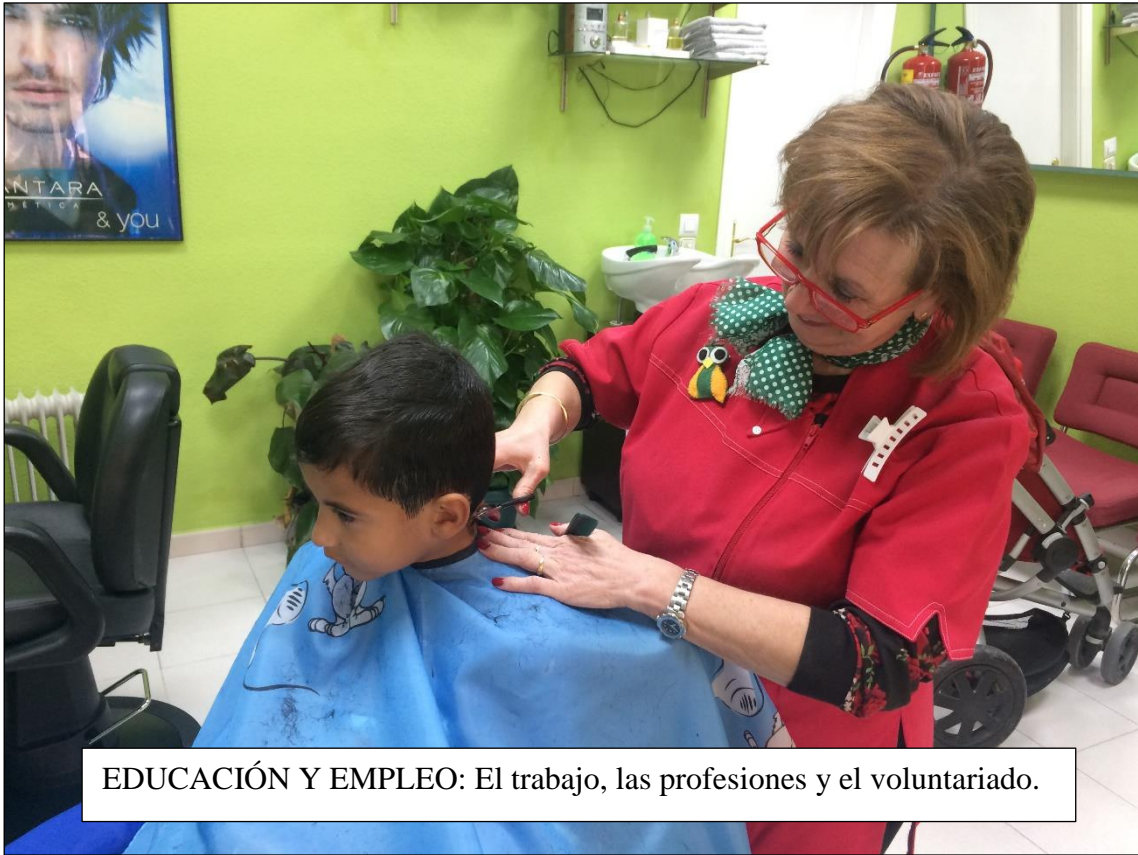
EDUCACIÓN Y EMPLEO: El trabajo, las profesiones y el voluntariado.