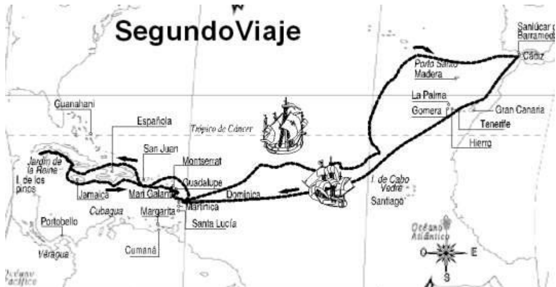
Imagen 5.- Mapa del segundo viaje de Cristóbal Colón a América

venganza, los indígenas habían destruido el fuerte. Tras esto, el descubridor decidió no tomar medidas en contra de la población local, en cambio sí explotó los recursos de oro y tomó esclavos y fue por esto, por lo que algunos autores han llamado a este proceso < la destrucción de las Indias >