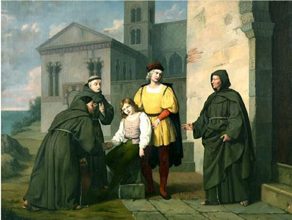
Imagen 3.- Cristóbal Colón y su hijo en La Rábida

que era hombre versado en cosmografía, le creyó. Y ahí empezó la aventura que terminaría con el descubrimiento y conquista de América. 21