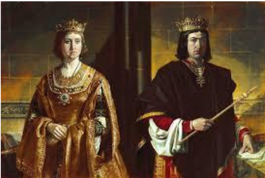
Imagen 1.- Isabel y Fernando, los Reyes Católicos

La monarquía, al tratarse de una de las primeras formas de Estado que supone la transición hacia la Modernidad, se encargó desde sus inicios de asegurar dos legitimidades; el origen y el ejercicio.