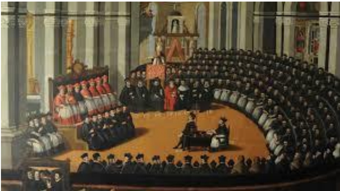
Imagen 9.- Concilio de Trento.

Debido a la evolución política que tuvo lugar en los siglos posteriores, el reconocimiento a esta escuela no llegó hasta hace algunos siglos atrás, pues las corrientes protestantes, que eran las mayoritarias en los temas científicos, no admitían la labor de estos teólogos españoles que fueron innovadores en el concilio de Trento. 42 Fue a mediados del s. XX cuando se comenzó a reivindicar el trabajo de los estudiosos salmantinos en campos tan importantes como el económico, pues fueron, entre otras cosas, los creadores de una corriente económica llamada <arbitrismo>