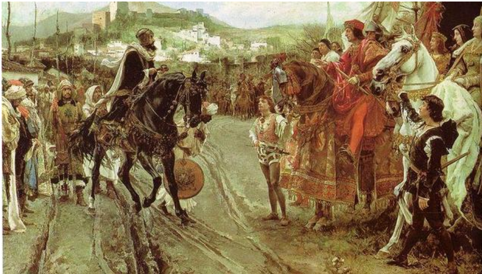
Imagen 8.- Boabdil entrega la ciudad a los Reyes Católicos.

Un hito histórico quedó recogido para la posteridad y fue el llanto de Boabdil ante su madre, doliéndose por la pérdida de Granada. Posteriormente se alzó el pendón real y se instaló la cruz sobre la torre de Campana.