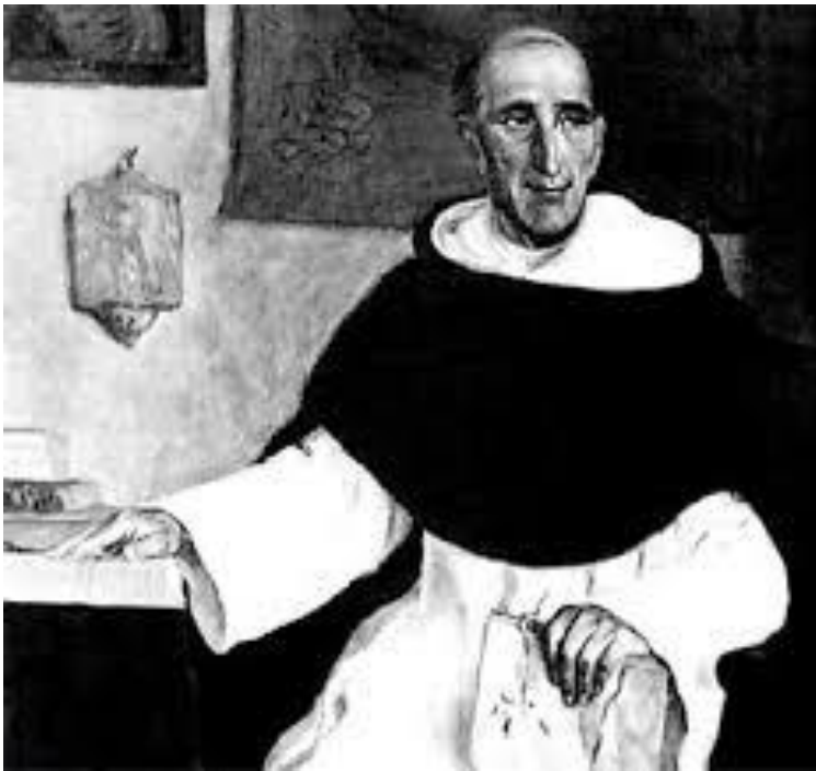
Imagen 10.- Francisco de Vitoria.

Francisco de Vitoria (Burgos 1583- Salamanca 1546) es considerado como uno de los teólogos más relevantes del llamado Siglo de Oro español. Llegó a ser docente en la Facultad de Teología salmantina, una de las importantes de la Cristiandad, ocupando ese puesto durante dos décadas consecutivas. Su carisma y personalidad le permitió ejercer gran influencia en la cultura humanista, pero no solamente durante su vida, sino a lo largo de varios siglos. Es conocido también diferentes méritos que hizo, pues fue nombrado como el mayor artífice del renacimiento teológico castellano, además de ser considerado como el precursor del Derecho Internacional Moderno, aunque sin duda, una de sus mayores aportaciones para la sociedad de la época fue la de inspirar un nuevo sistema de colonización, donde la paz era la clave.