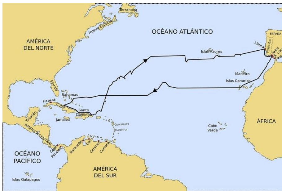
Imagen 4.- Mapa del primer viaje de Colón a América