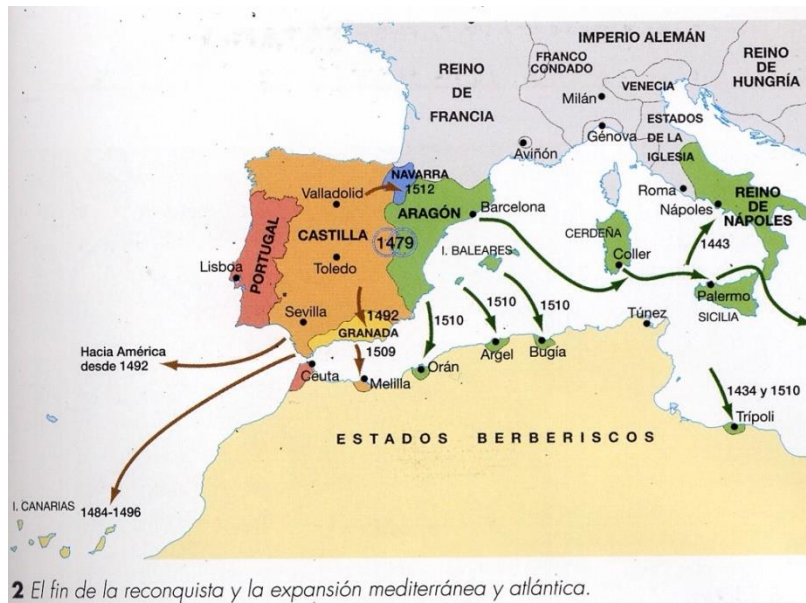
Imagen 6.- Mapa europeo de la expansión española en el Mediterráneo