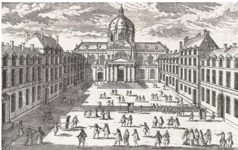
Imagen 11.- Universidad de París