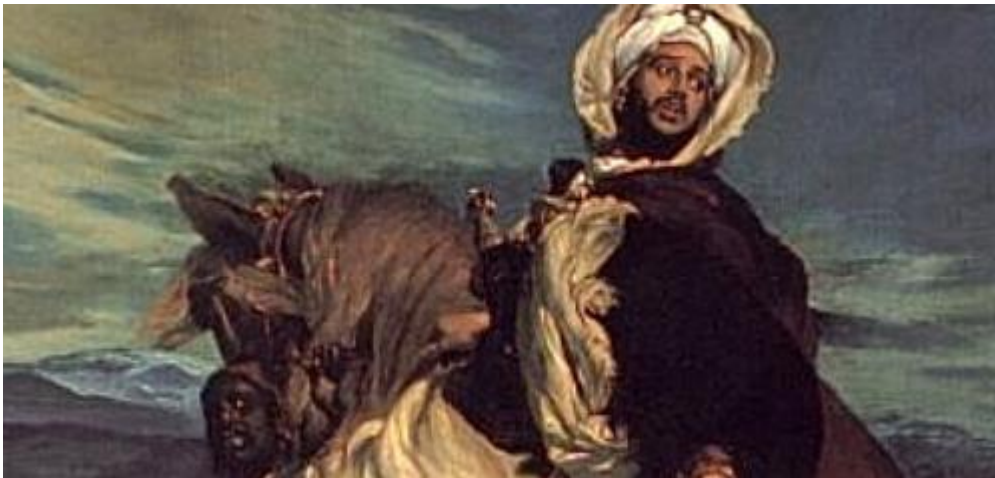
Imagen 7.- Rey Boabdil de Granada

Tras la pérdida de Alhama, los partidarios de Fátima, comenzaron a crear un plan para derrocar a Abu-l-Hasan y poner en su lugar a Muhammad Abu' Abd Allah , quién posteriormente sería bautizado como Boabdil por los cronistas cristianos. El propio Boabdil y su hermano Yusuf escaparon de la Alhambra para dirigirse a otros lugares con la misión de buscar apoyos. Boabdil los encontró en Guadix, y fue aquí donde sería nombrado Emir, y su hermano encontró apoyos en Almería.