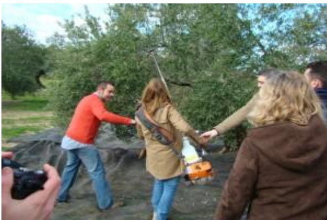
Imagen 12. Aceitunero por un día.