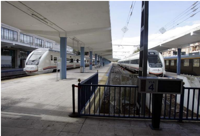
Imagen 4. Estación de tren de Jaén.

Procedencia: http://jaenblogs.ideal.es/jaenpuertodemar/files/2011/11/tren.jpg