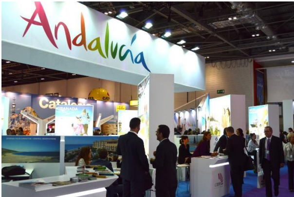
Imagen 13. Stand Andalucía World Travel Market.