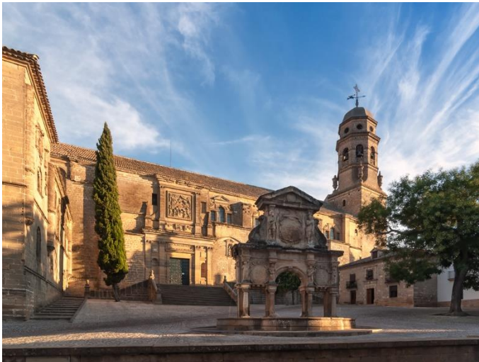
Imagen 8. Plaza de Santa María y Catedral de fondo.