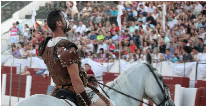
Imagen 9. Fiestas Íberoromanas Cástulo.