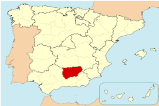
Imagen 1. Localización de la provincia de Jaén.