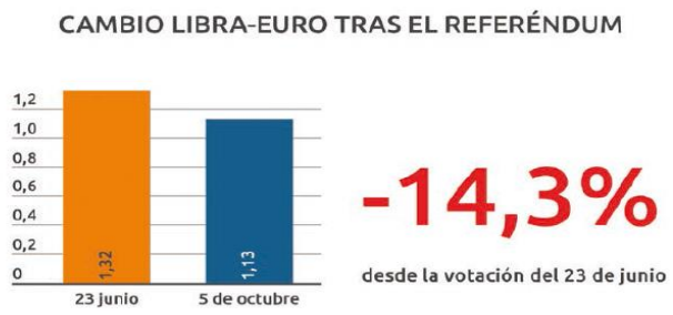
Imagen 16. Depreciación de la libra frente al euro.