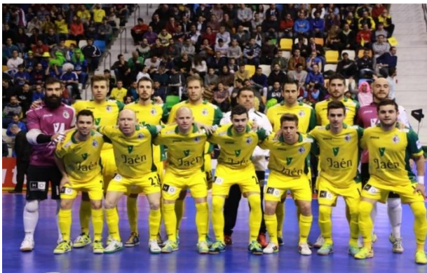
Imagen 14. Patrocinio Jaén Paraíso Interior