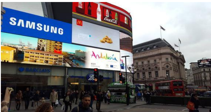
Imagen 15. Publicidad de Andalucía en Piccadilly Circus.