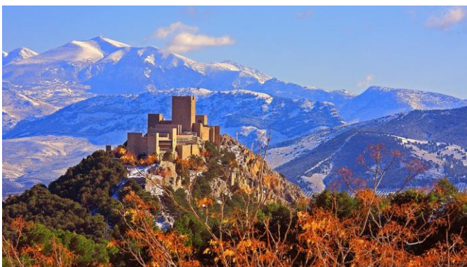
Imagen 6. Castillo Santa Catalina. Jaén.