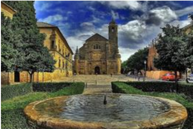
Imagen 7. Plaza Vázquez de Molina con Capilla Funeraria del Salvador del Mundo al fondo. Úbeda.