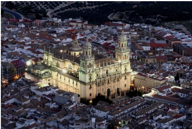
Imagen 5. Catedral de Jaén.