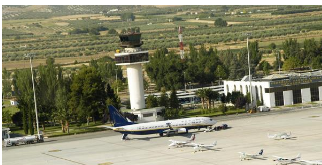
Imagen 3. Aeropuerto Granada-Jaén