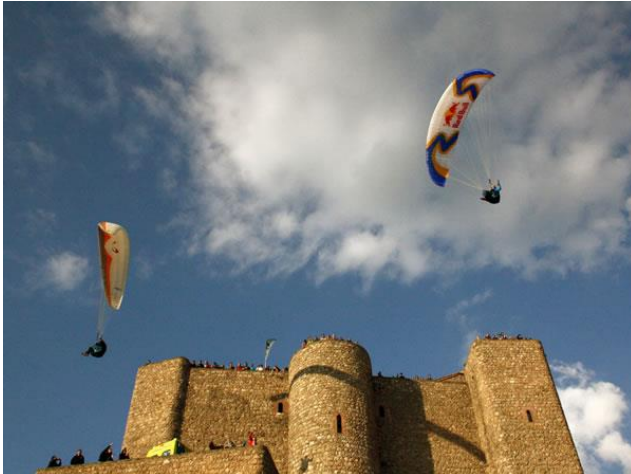
Imagen 10. Festival Internacional del aire.