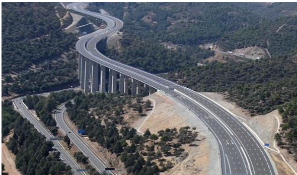
Imagen 2. Acceso por carretera. Nuevo trazado de Despeñaperros.