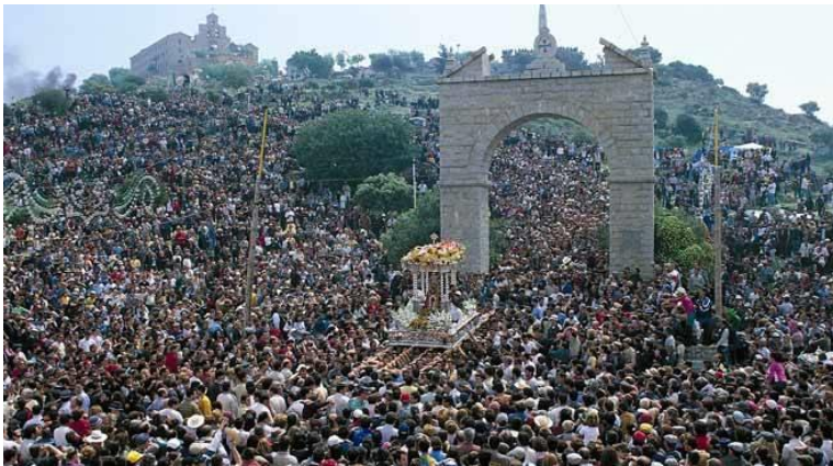
Imagen 11. Romería virgen de la cabeza.